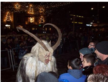
Perchtenlauf Das Fürchten lehrten uns im Dezember die verschiedenen Perchtengruppen bei ihrem Perchtenlauf in Neunkirchen.