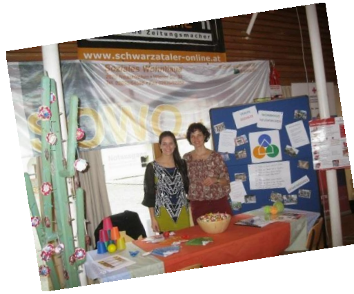
Optisch unübertroffen, unser Stand auf der Sozialmesse in Reichenau an der Rax

Seebensteinerstrasse 10, 2620 Neunkirchen Tel/Fax: 02635 61698 Mobil: +43 (676) 7086332 Email: bw@sowo.at