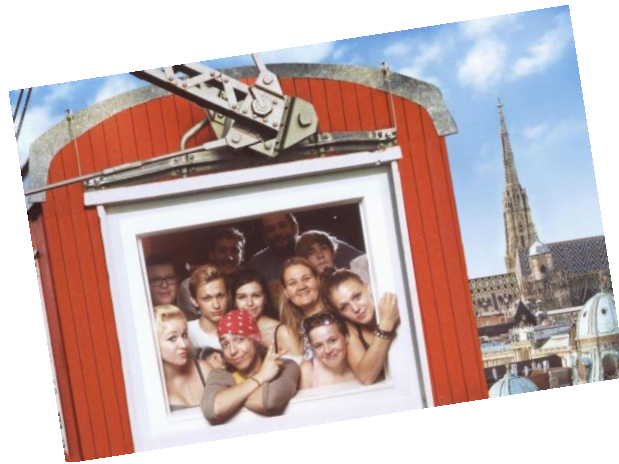
Jährlich auf dem Programm steht ein Ausflug in den Wiener Prater, wo uns das Riesenrad immer dazu einlädt, mit ihm eine Runde zu drehen

Alleegasse 2A, 2620 Neunkirchen Mobil: +43 (676) 6975855 Email: juwo@sowo.at