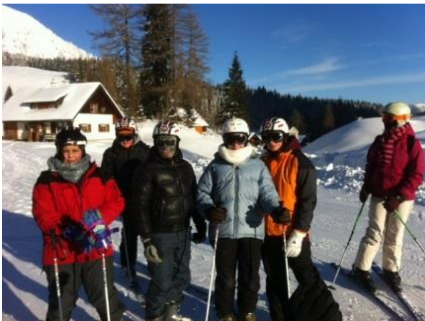
Spaß und Erholung im Salzburger Land

aufhalten und nutzten die wunderschönen Pisten. Ein Abenteuer ganz besonderer Art war unsere Nachtwanderung mit anschließender Rodelfahrt durch den tief verschneiten Wald. Die KlientInnen genossen die Tage in den Bergen sehr. Neben Spaß und Erholung war das gemeinschaftliche Erlebnis in der Gruppe sicherlich die schönste, tiefgreifendste und wahrscheinlich auch lehrreichste Erfahrung.