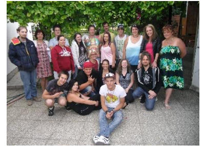
„Cheese“ ☺ Gruppenbild in unserem Garten