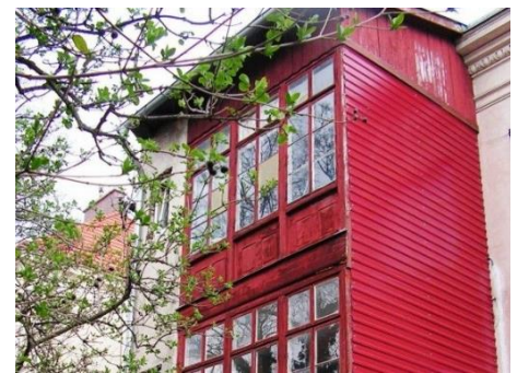
Jugend-Wohngemeinschaft in der Wiener Straße