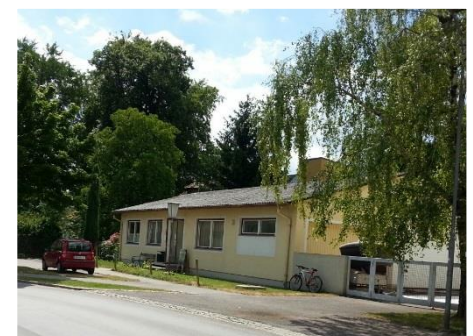
Junges Wohnen in der Alleegasse