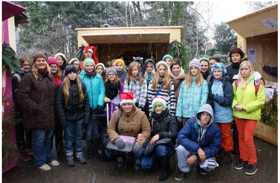
Weihnachtsmarkt des gesamten Vereins

Schöllnerstrasse. Jugendliche und BetreuerInnen von Jugend-WG, JuWo und Betreutem Wohnen halfen zusammen und versorgten die zahlreichen Besucher mit Punsch, Imbissen Keksen und Weihnachts-Basteleien. Unser spezieller Dank gilt dabei auch heuer wieder der Bastelrunde Wimpassing für ihre tatkräftige Unterstützung!