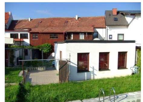
Betreutes Wohnen in der Seebensteinerstrasse