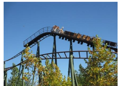
Der Herbst wurde dann durch einen Besuch im Familypark eingeläutet, der auch für „große Kinder“ noch jede Menge Spaß zu bieten hat