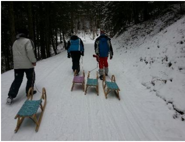
Winterferienaktion in Altaussee Unsere diesjährige Winterferienaktion verbrachten wir im JUFA Altaussee. Die Aktivitäten reichten von Skifahren und „Tubing“ im Skigebiet Kreischberg bis zum Thermenbesuch und Ballspielen in der Turnhalle.