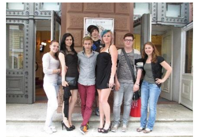
Höhepunkt der ersten Jahreshälfte war das Musical „Natürlich blond“ im Wiener Ronacher