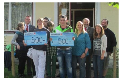
Vielen Dank an Sparkasse Neunkirchen & Lionsclub. Über ihre großzügigen Spenden als Zuschuss für unsere Ferienaktion waren wir sehr dankbar