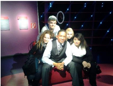
Madame Tussauds Der erste Frühlings-Ausflug führte unsere Kids nach Wien zu den Wachsfiguren von Madame Tussauds. Weitere Ausflüge : Bowling, Klettern und Fischen.