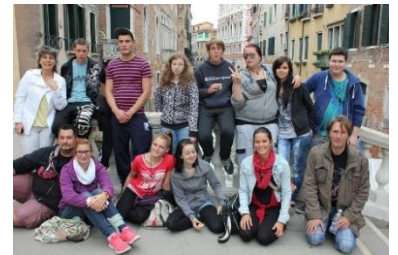
Sommerwoche in Italien Gemeinsam mit dem JuWo verbrachte das BW dieses Jahr entspannte und kulturelle Tage am italienischen Meer in Lignano und Venedig