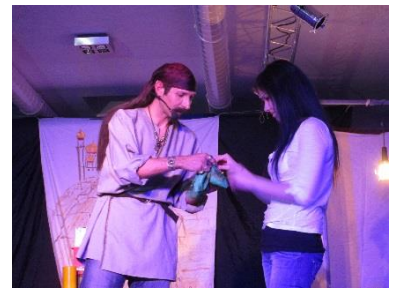
Gemeinsame Ausflüge sind das Gruppenhighlight jeden Monats, wie hier bei wie einer Zaubershow unseres Lieblingsmagiers Mandom