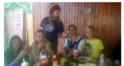
Grillabende in der Laube Sobald das Wetter es zulässt wird die langersehnte Gartensaison eröffnet. Unser Garten mit Grill und Pool garantiert einen erholsamen Ausgleich zum oft entbehrungsreichen Alltag