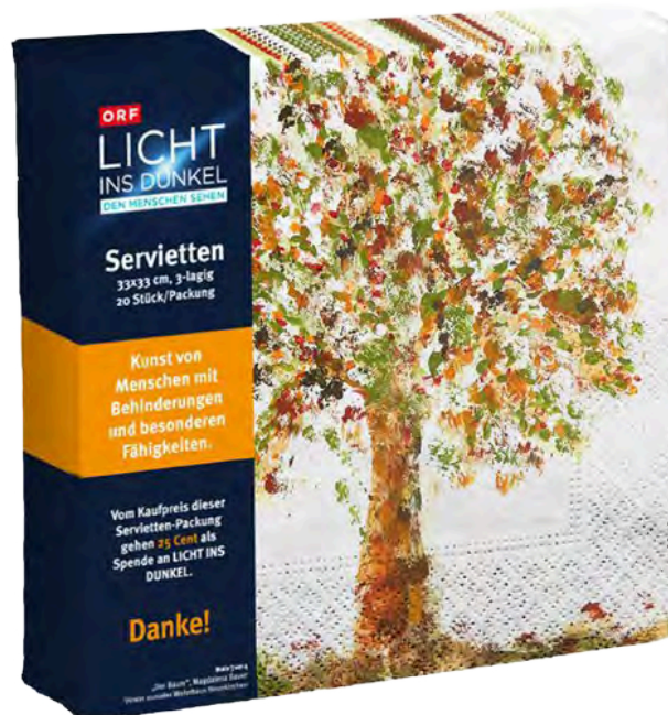
SERVIETTEN MIT KUNSTVOLLEM MOTIV